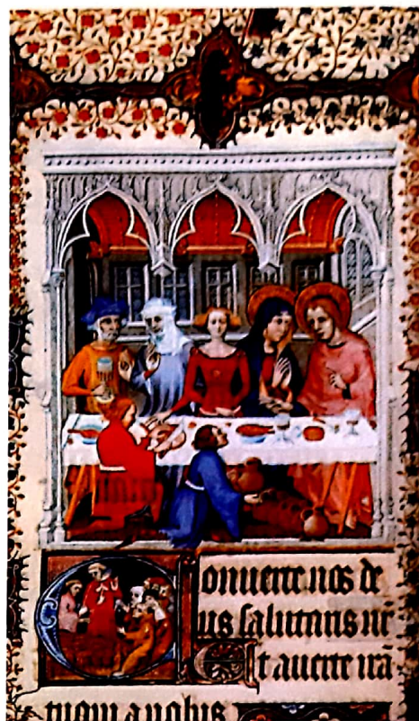
NOCES À CANA. La Croix et le Cœur transpercé ne peuvent se comprendre sans le récit des noces de Cana. Le véritable époux est Dieu et l'épouse l'Église, représentée par Marie. ( Les Noces de Cana , enluminure du XV e s. extraite des Grandes heures de Jean de Berry ).

Cette mystique du Cœur de Jésus se déploiera au XIII e siècle dans toute l'Europe, notamment en Allemagne